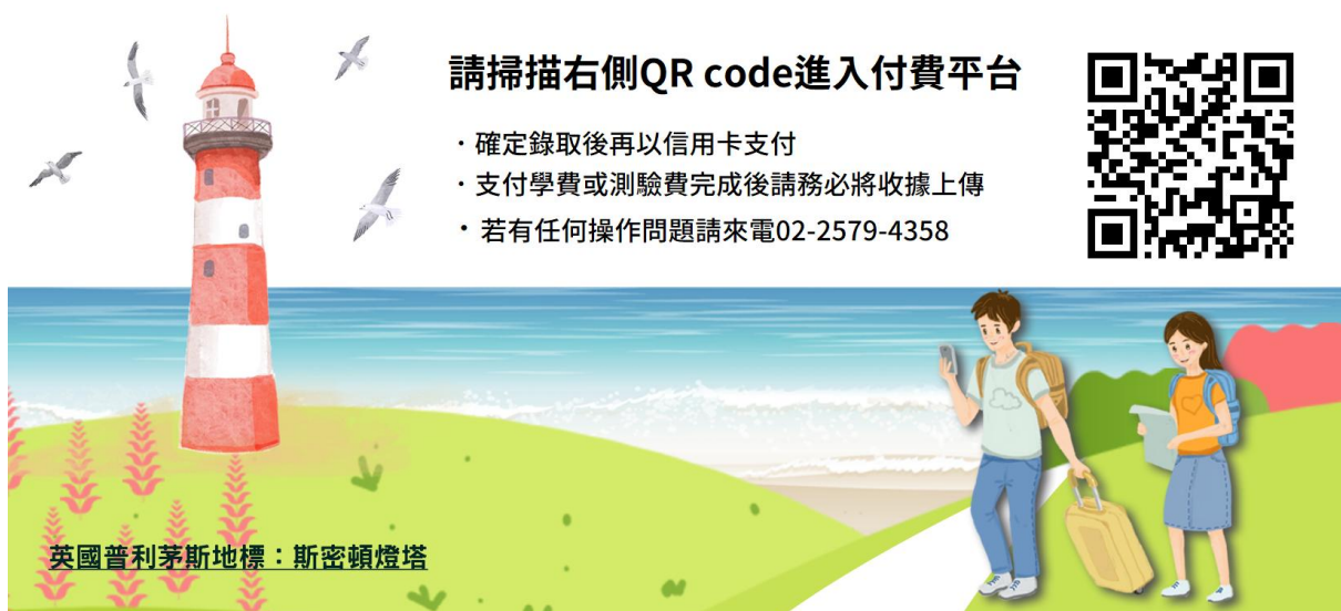
英國普利茅斯地標：斯密頓燈塔